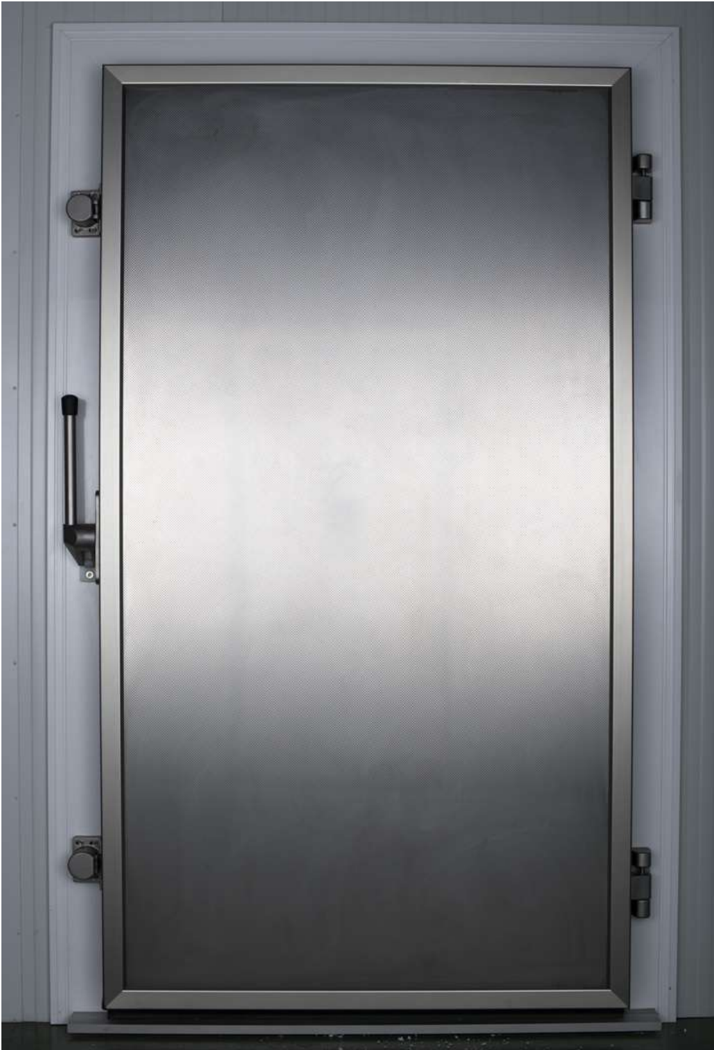
Fotos Puerta DP-2