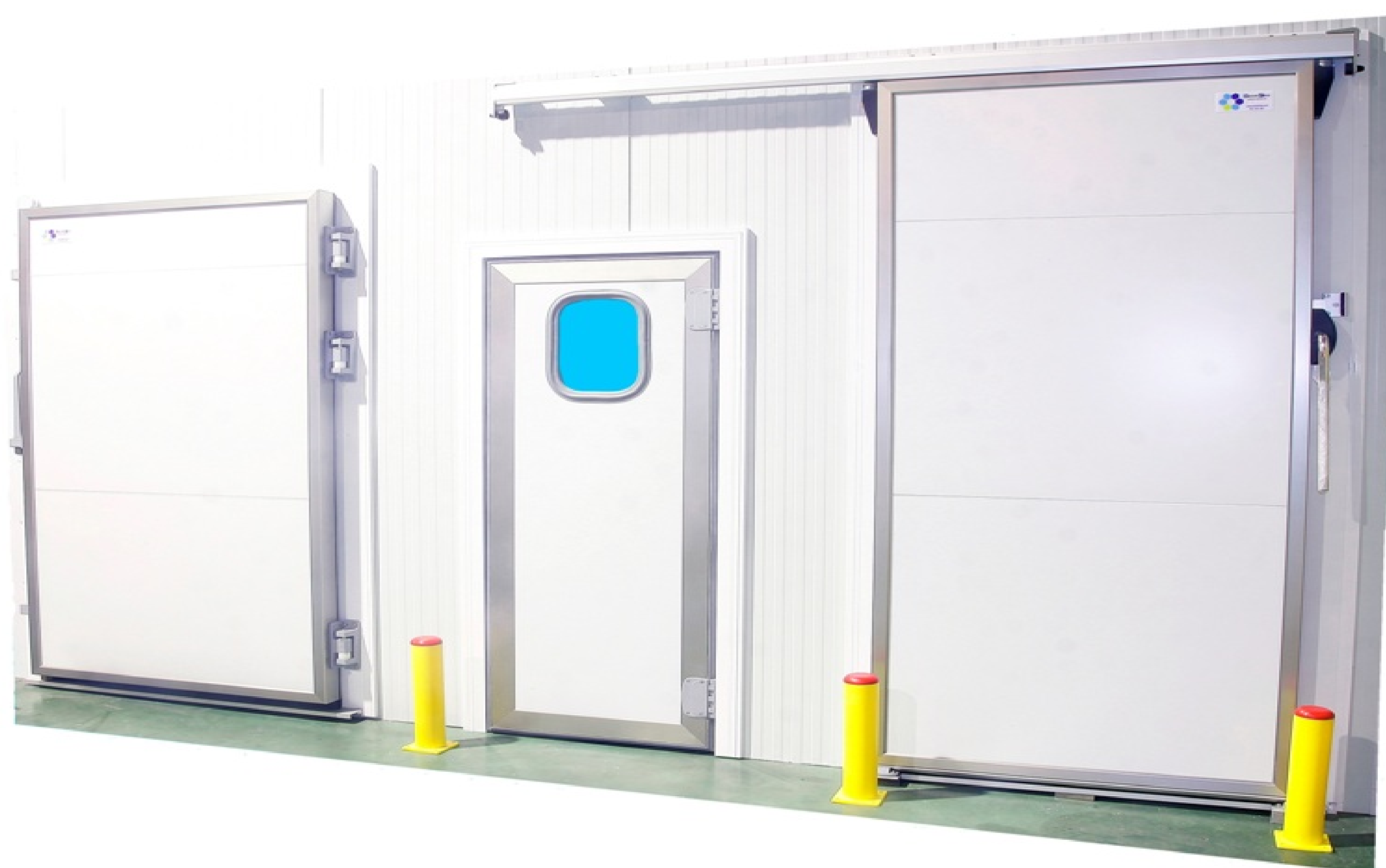
Foto puerta frigorífica DC-1 con opciones